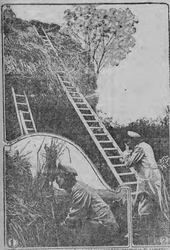
En el grabado No. 1 aparece un soldado alemán que a la orilla de un camino y con relativo confort, lleva cuenta de las fuerzas aliadas que pasan a su vista. En el grabado No. 2 otro "topo" alemán, metido en su cueva, acompaña a un oficial que a ras de la superficie del terreno, observa los movimientos del enemigo, cómodamente instalado.

fensas de alambres de púas y comenzaron a gritar: ¡No tienen! Sin embargo, como ya han empleado otras veces igual extratema, nuestras tropas no se dejaron engañar por esta maniobra, y abrimos contra ellos un fuego mortífero e hicimos un contra ataque, rechazándolos e infligiéndoles grandes pérdidas. En Galicia ha habido fuego de cañón y de fusilería y seguimos en contacto con el enemigo. PARIS, 2.—Un boletín oficial dice: "No hay ningún cambio en la situación." LONDRES, 12.—El correspondiente del "Daily News" en Roma comunica que en Viena hay agitación contra la severidad de la censura, que sólo sirve para extraviar al público, suprimiendo sistemáticamente las noticias desfavorables. En una reunión de hombres de negocios se tomó un acuerdo para que se atenúa la censura. La "Neue Freie Presse" apoya energicamente la proposición. NOTA.—AL LLEGAR AQUI SE INTERRUMPIÓ LA COMUNICACION CON LA OFICINA TELEGRAFICA DE "LA CRUZ", A CAUSA DEL FUERTE VIENTO QUE SOPLA.